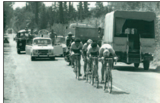
100km contra la montre dans la campagne algéroise